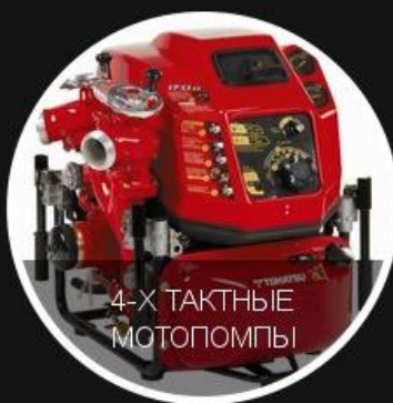
4-Х ТАКТНЫЕ МОТОПОМПЫ