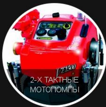
2-Х ТАКТНЫЕ МОТОПОМПЫ